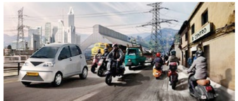
Mehr Unternehmen. Für weltweite Mobilität.